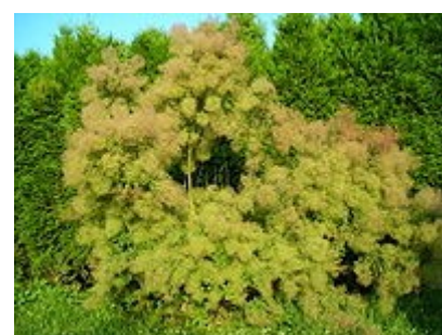
Árbol del humo ó árbol de la pelucas.

Nombre común: Árbol de las pelucas , árbol del humo, fustete.