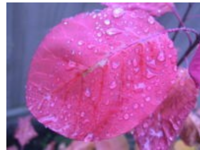
Hoja de Smoke tree.

Los "árboles del humo", particularmente C. coggygria , son arbustos de jardín muy populares. Varios cultivares de C. coggygria que tienen hojas de color bronce o púrpura, se han seleccionado, con las inflorescencias rosadas cálidas en contraste con un follaje púrpuro negro; las más comunes en los comercios son las 'Notcutt's Variety' y 'Royal Purple'. Cuando estas se cultivan juntas, las dos especies formarán híbridos ; algunos cultivares de jardín están en esta familia.