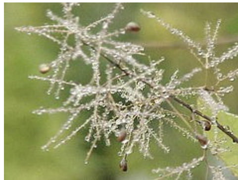
Cotinus coggygria cabezas florales con frutos y gotas de rocío