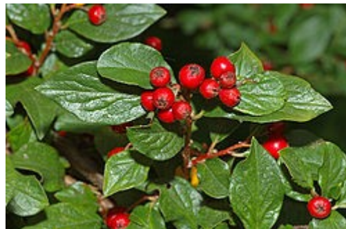
Cotoneaster acuminatus , hojas y frutos